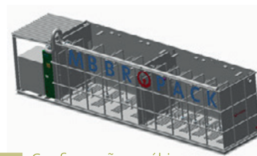
Configuração aeróbica AEAE

O MBBR Pack está disponível em várias configurações, dependendo das metas de tratamento do cliente para carbono e/ou nitrogênio. Portadores AnoxKaldnes são um componente vital no MBBR Pack.