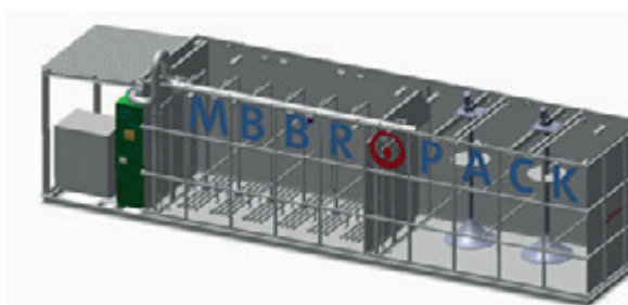
Anóxica - Configuração aeróbica ANAE